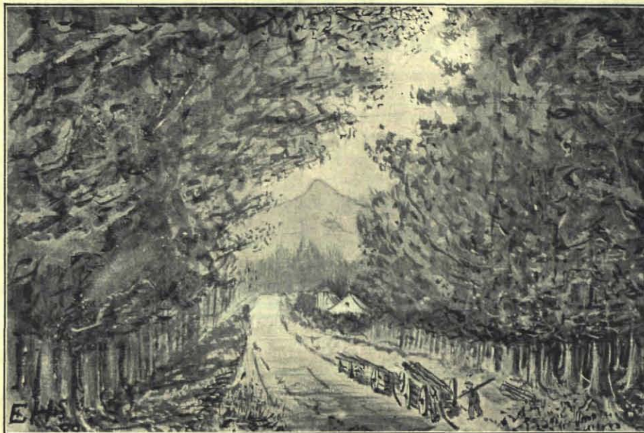
Op den Bentheimer straatweg bij Oldenzaal. (Niet ver van de Uitspanning „Het Zwaantje”). In 't verschiet het slot Bentheim op de rots.