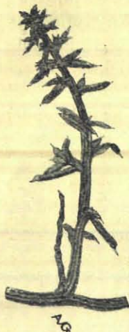
Takje van Salsola kali .

Leverkruid ( Agrimonia Eupatorium ) en de purperen aren van den Kattestaart ( Lythrum ) uit het gras kijken, benevens vele andere mooie planten. Hier vind ik ook Bleekgeel Roerkruid ( Gnaphalium luteo-album ) een neefje van het Edelweisz.