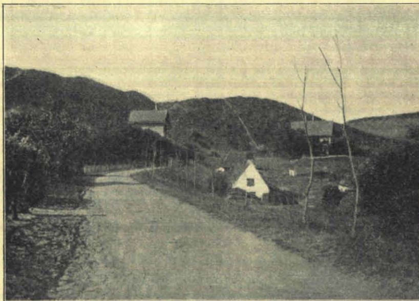
Bij Wijk aan Zee.

vlak aan zee ligt. Eerst vind ik niet veel, maar als ik het laatste duin over ben, zie ik wel, dat de onderwijzer gelijk heeft gehad. Behalve de Zee Kruisdistel ( Eryngium maritimum ) vind ik er nog verschillende andere zeeplanten. De eerste is Duin Winde ( Convolvulus Soldanella ), die wat de bloem betreft het dichtst bij Haag Winde ( C. Sepium ) komt. Verder vind ik Honkenya peploides, de Zoutbloem, een plantje van niet meer dan 1½ dM. hoog met dikke vleezige bladen en witte bloempjes, en Euphorbia Paralias , de Strand-Wolfsmelk