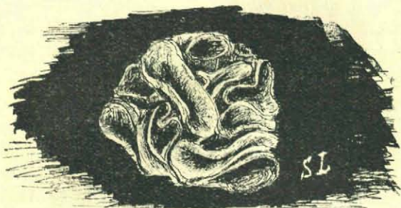
Een vreemde Peziza .

Nog eenige vondsten zal ik vermelden, en dat zijn het kleine parasolletje en de „stuifbal” Scleroderma . Van de laatste trof ik een heele groep stuivende exemplaren. Ook Lycoperdon verspreidt zoo zijn sporen, maar daartoe opent