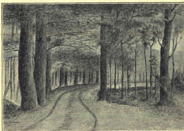
Weg door het Klooster.

De gloeiende zonneshijf ging vurig dalen en is gezonken achter de kim.