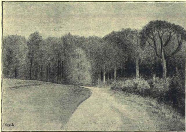
Gezicht op het Klooster.

en de stammen der boomen in licht- en donkergroene, geel- en grijsachtige tinten. Nu we toch al op kleuren gelet hebben vergeten we ook de lichtgele bladeren der kamperfoelie en de donkergele der populieren en groengele der vuilboomen niet en krijgen we oog voor het groen met