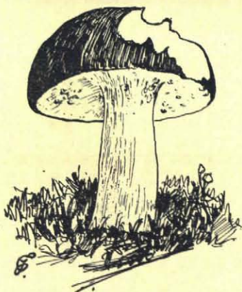
Boletus granulatus aangevreten door een merel.

waren weggehakt. Sommige zelfs waren geheel verkrumeld, tot op den steel toe. Eekhorentjes komen in Bloemendaal nog niet in 't wild voor (ze beginnen zich anders hier en daar in Holland te vertoonen) dus lag het vermoeden voor de hand, dat hier vogels aan 't werk waren geweest. Daarom bevroop ik eenige dagen achtereenvolgens à la Old-Shatterhand het denbosch en ik had het groote genoegen telkens zanglijsters en merels te bespieden, die druk bezig waren