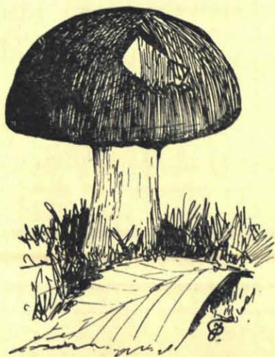
Boletus luteus aangevreten door zangluster.

Natuurlijk was het hun hoofdzakelijk om de larven te doen, die in Boletus -hoeden zelfs in zeer jeugdigen toestand reeds aanwezig zijn. De muggen en vliegen leggen hun eieren meest aan de stelen aan de onderzijde van den hoed, en zoodra de larven uit 't ei komen, kruipen ze door de sporenbusjes naar het hoedweefsel. 't Sporenbusje wordt daarbij dan doorgaans vernield. In de onderste laag van het hoedweefsel zijn altijd de meeste larven te vinden en dat hebben de slimme lijsters op de een of andere manier ontdekt.