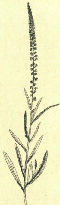
Reseda luteola (Wouw).