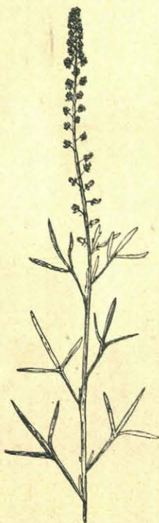
Reseda lutea (Gele wouw).

ons land naar Deventer reisde, werd meer dan tureluurs, toen hij al zijn moeite en reiskosten met den schralen inventaris van ons terreintje vergeleek. Misschien schuilen er onder de