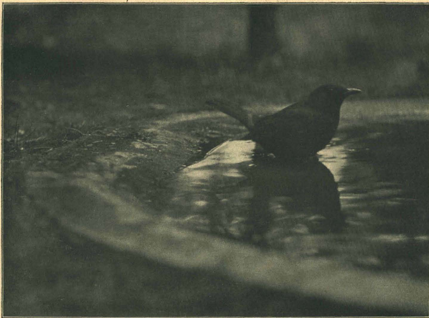
Merelman aan de bad- en drinkplaats.