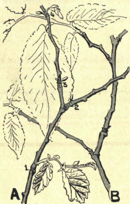
15 Mei 1918.

Door deze slapende knoppen tot ontwikkeling te brengen, maakt dus een sterk bloeiende iep zijn aantal bladeren weer volledig. Dit is het normale geval. In gewone jaren valt echter het achterna komen van de bladeren uit de slapende knoppen niet zoo op, omdat hun ontwikkeling als het ware wordt gemaskeerd door de vruchtjes, en als deze zijn afgevallen, zijn de nieuwe bladeren zoo ver gered, dat de boom voortdurend gevuld blijft. In 1918 is er echter, door het ontbreken van de vruchtjes, een kale periode tusschen het ontstaan van de twee stellen bladeren ingeschoven.