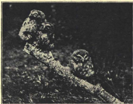
Fig. 3. De steenuiltjes van Schuilrust.

Sommige namen zooals het Paradijs (zie foto 6) zijn evenwel door de verwording en uitdroging in den loop der jaren niet erg toepasselijk meer. Het Paradijs is nu één groote zandwoestijn, een stuifrein van je welste en heeft nu niets meer van wat we ons van het paradijs voorstellen. De vroegere bewoners van dit Paradijs, twee oudjes (men sprak toen van Adam en Eva uit het Paradijs) kunnen je nog heele verhalen doen van dit terrein. Daar werden toen 40 à 50 jaar geleden koeien en paarden geweid, het was een begroeid en vrij vruchtbaar duinterrein met mooie duinweiden. Met het steeds droger worden der duinen verdwenen met de grasweiden de paarden en dit is typisch, ook de geelgorzen. De geelgors is in het geheele A. W. duin geen broedvogel meer, uitgezonderd in het Paardenkerkhof. Ook de grauwe klauwier lijkt me in aantal sterk af te nemen. Vroeger jaren was deze worger een zeer algemeene broedvogel; vooral in de vlier-boschjes in de zee-reepduinen konden we elk jaar verscheidene nesten aantreffen. Hoe staat het met de klauwier in de andere duinen?