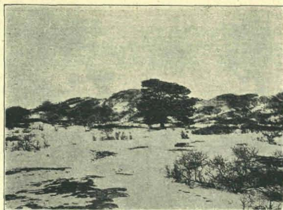
Fig. 5. Het Hondenvlak in sneeuw

het Zandvoorter vlakje, ook hier is de grutto in de laatste 10 jaren verdwenen. De tureluur komt zoo hier en daar over het geheele terrein verspreid als broedvogel voor, terwijl de echte duinbewoners, onze wulp en scholekster er bij dozijnen broeden. Dit jaar leek me het aantal scholeksters zeer groot; de Oranjekom is in het vroege voorjaar nog steeds de geliefkoosde verzamelplaats van deze mooie vogel. Het gebeurt dan wel, dat er zoo'n dikke honderd bonte-pieten op het talud staan. Allengs, als de broedtijd nadert slinkt de scholeksters-bende, ze trekken dan paarsgewijs het duin in en begin Mei is meestal de geheele troep verdwenen. Dan komen al gauw de oeverlooptjes; deze kunnen we haast den geheelen zomer door aan de kanalen aantreffen en het is misschien niet geheel onmogelijk, dat deze in Nederland zeldzaam voorkomende broedvogel, ergens aan de begroeide oevers van de kanalen nestelt.