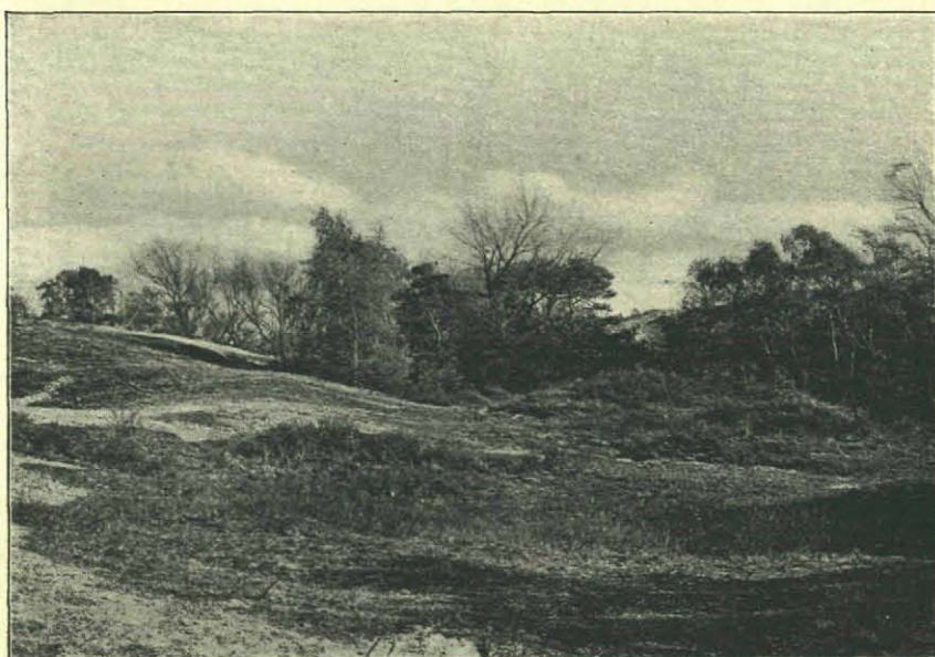
Fig. 4. De Donderhoek.