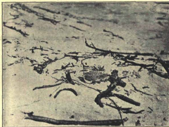
Fig. 7. Broedend strandpleviertje.

eenige jaren achtereen nesten vond op bijna dezelfde plekjes; dit is trouwens niet alleen het geval met grielen, maar ook met kieviten, wulpen, scholeksters, grutto's, strandpleviertjes en zelfs met vinken, groote lijsters, staartmeezen en vooral met roofvogels. Ik ken een merel, die de eigenaardige gewoonte heeft, om z'n nest in den grond te bouwen, zoo op de manier van een boomleeuwerik, en als we nu zoo in April naar z'n nest zoeken, dan vinden we dat al heel gauw als we in de onmiddellijke nabijheid van de oude nesten van de vorige jaren gaan kijken; zoo'n stuk of 5 oude nesten, allen in den grond gebouwd, nesten waarvan we, door de eigenaardige neststand en bouwwijze, met vrij groote zekerheid kunnen zeggen, dat ze van één en dezelfde vogel zijn.