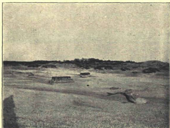
Fig. 6. Stuifkuil in het Paradijs.

Wat het aantal kieviten betreft, het scheen me toe dat dit minder was dan vorige jaren; de jachtopzieners beweren dat de kieft uit deze duinen verdwijnt, elk jaar wordt de buit, d. w. z. kievitseieren, kleiner en kleiner. En dan de griel, ik heb