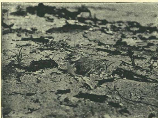
Fig. 8. Broedend strandpleviertje.

In de zeekantduinen broeden behalve enkele strandpleviertjes en bontbekjes ook vrij wat vischdieven en zilvermeeuwen. Met die zilvermeeuwen gaat het jammer genoeg niet best, hun aantal gaat achteruit, dit jaar was van een kolonie-gewijs broeden geen sprake, de nesten lagen zeer verspreid en de vogels hadden erg te lijden van nestenzoekers en eieren-uithalers. In verband met deze achtervolging viel het me dit jaar op, dat de zilvermeeuwen van de aardige en steeds grooter wordende kolonie nabij „de Westen” op Texel zich veel en veel minder schuw en wantrouwig toonden, dan de zilvermeeuwen bij paal 75. De Texelsche zilvermeeuwen keerden al heel gauw op hun nesten terug, enkele makke individuen konden we zelfs tot op enkele tientallen meters naderen en op ons gemak bekijken, terwijl ze doodbedoord op hun eieren zaten. En dat was in het begin van den broedtijd, de meeste vogels hadden nog maar een of twee eieren.