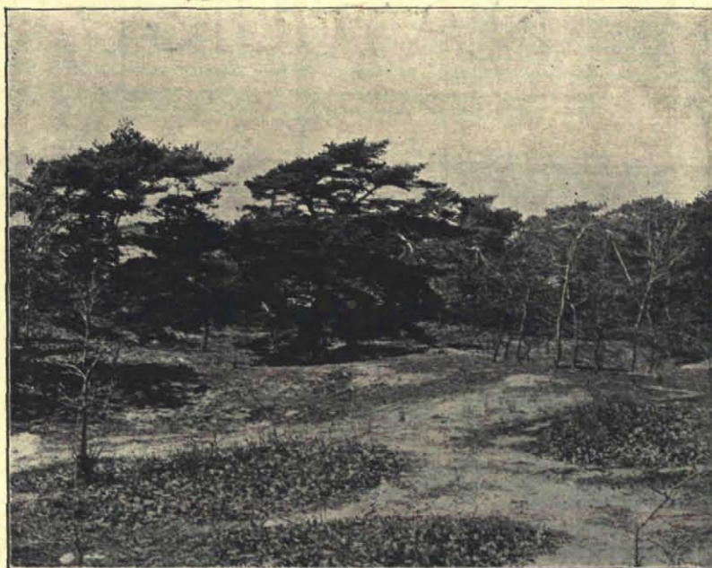
Fig. 1. Achter het Pannenland. Geliefkoosd terrein van nachtzwaluwen en grielen.

Die er kwamen, enkele gevallen uitgezonderd, waren ernstige wandelaars, liefhebbers en menschen, die er wat voor over hadden om eens een halven of heelen dag