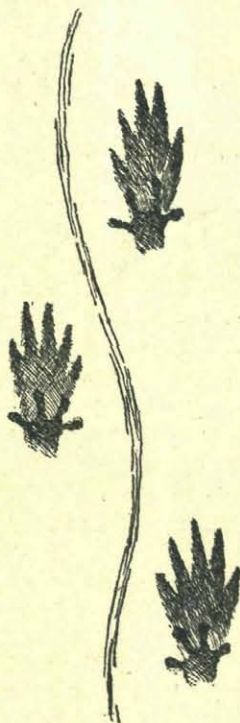
Fig. 3. Het Scor van de Muskusrat.

Niettegenstaande deze dieren zoo talrijk zijn geworden, treft men ze niet algemeen in diergaarden aan, of zijn ze levend te verkrijgen. Die ik zag in de diergaarde te Dresden is in het Ertzgebergte uitgegraven van onder de sneeuw. In een klein hokje, geven deze diertjes geen aanzicht, het is beter in een ruimere omgeving met beton ondervlak en gevuld met z.g. (scherp) rivierzand. Zij kunnen dan hun holen graven — en daar het schemerdieren zijn, kan de bezoeker er tegen het vallen van den avond hun spelen en wroeten aanschouwen. Zij kunnen na eenigen tijd zeer tam worden, zooals men dat wel eens zien kan van onzen vischotter in gevangen staat. Om hun sterken reuk is het ook niet aan te raden, deze dieren in kleine kooien te houden.