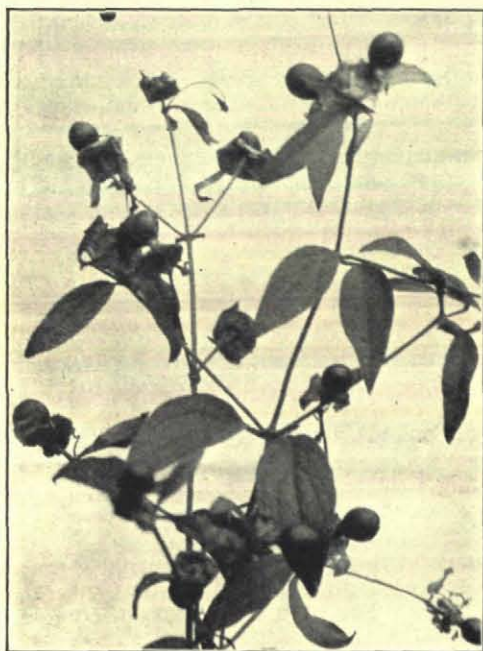
Fig. 1. Cucubalus baccifer .

Orobanche speciosa. — Een mooie bremraap, zoo niet de mooiste. Ik kan dan ook niet nalaten, er de aandacht op te vestigen. De cultuur is zeer eenvoudig. Men legt eenige tuinboonen zes centimeter diep en zaait op de boonen het zaad uit, waarna alles met grond gedekt wordt. De bloemen zijn bijzonder fraai. Lila met wit en de slip oranje geel. Vermoedelijk is het zaad bij onze