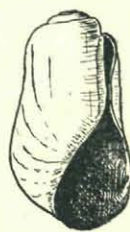
Retusa obtusa (Mont.) 6 × vergroot.

Tot voor korten tijd kenden wij slechts leege schelpjes, afkomstig uit de gemeenten, die hierbij op een kaartje zijn aangegeven: Texel, Terschelling, West-Dongeradeel, Schoorl, 's-Gravenhage, Loosduinen, Goedereede, Domburg, Nieuwen Sint-Joosland, Hoofdplaat, Bergen op Zoom.