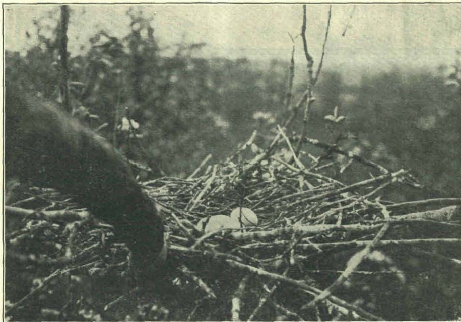
Reigernest op Ebenhaëzer in de Beemster.

Een tweede reigerkolonie, die ook geduld wordt is de kolonie op „Eben-Haezer" in de Beemster. Daar nestelen ze in een oude boomgaard, in peren-, appelen en pruimenboomen en toen ik hier in de laatste Aprilweek van dit jaar weer eens heen trok, was het een schilderijtje. De boomen bedekt met hun weelderige bloesemdeken, de nesten witgekalkt en de karakteristieke vogels daarbij, en dan vrij laag, zoodat je ze op je gemak kan bekijken, leverde een prachtig gezicht op. Ik beklom den eenen boom na den ander en wanneer ik dan even stil zat en een blik kon slaan in een dozijn nesten rondom me, met eieren of jongen, dan streken de oude vogels al heel gauw. Zoo'n reigernest, met de prachtig blauw-groene eieren, temidden van de rose appelbloesem, en dan zoo'n vogel in z'n beste pakje, want in Maart en April zijn de reigers op z'n mooist, was waarlijk onvergetelijk. Er waren 48 bezette nesten en in ailen nam ik een kijkje en toen ik ten