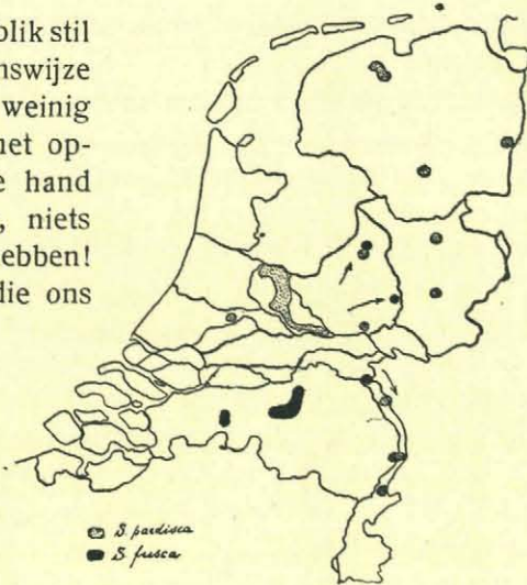
Verspreiding van Sympecma in Nederland.

Dan, in Maart en April, — op zonnige, zoete dagen soms al in Februari! — komen ze weer te voorschijn, vliegen in heele scharen rond en bereiden zich al gauw voor op de gewichtige taak: de voortplanting en het eierleggen. Zoodra dit is geschied, neemt het aantal individuen langzamerhand af, zoodat men tegen half Mei reeds moeite genoeg heeft, om een enkel exemplaar dezer waterjuffers machtig te worden. De eitjes zullen vermoedelijk wel zeer spoedig uitkomen, terwijl ook de jonge larfjes een zeer snelle ontwikkeling moeten doormaken, ten einde in Augustus volwassen te zijn en tegen dien tijd eene nieuwe generatie voort te brengen. De geheele ontwikkelingsduur strekt zich dus slechts uit over ten hoogste 4 maanden! Van meer dan ééne generatie per jaar is echter geen sprake, daar de jonge herfst dieren zich zonder twijfel niet voortplanten en de wijfjes in onbevruchten staat overwinteren.