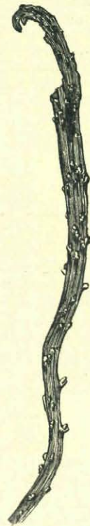
Bandvorming bij brem.

De Mol op Walcheren. — Naar aanleiding van het berichtje van G. op pag. 270 van dezen jaargang over den mol op ons eiland kan misschien het volgende opgenomen