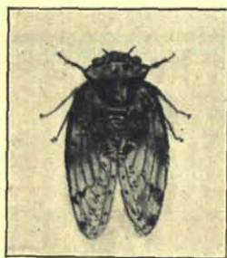
Cicada sp. Bandoeng 1916.