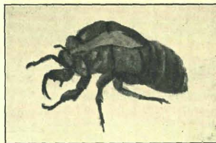
De huid van de nymph der Cicade.

Een cicade vloog naar den eersten kunstenaar, zette zich op de harp, op de