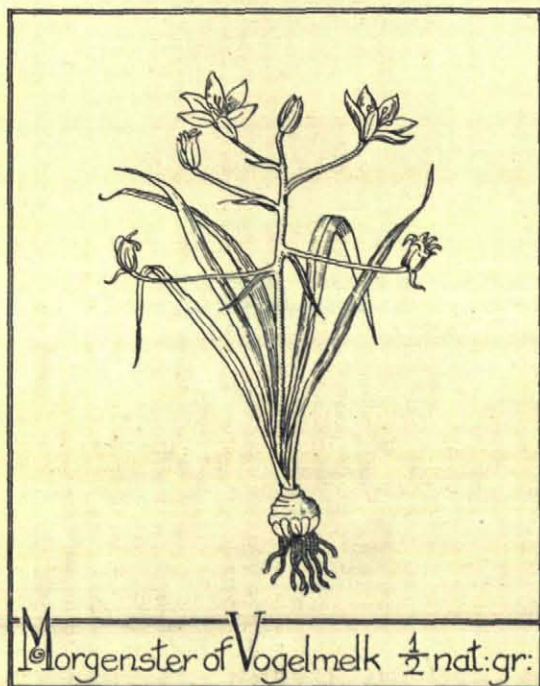
Morgenster of Vogelmelk \frac{1}{2} nat. gr.

Maar sedert jaren is nu het terrein afgesloten. Bloemenventers uit de steden kwamen ze met zulke enorme massa's weghalen, zelfs met bol en al, dat weldra van heel het sneeuwkloukenveld niets meer over zou zijn. Toen heeft de eigenaar er verboden terrein van gemaakt.