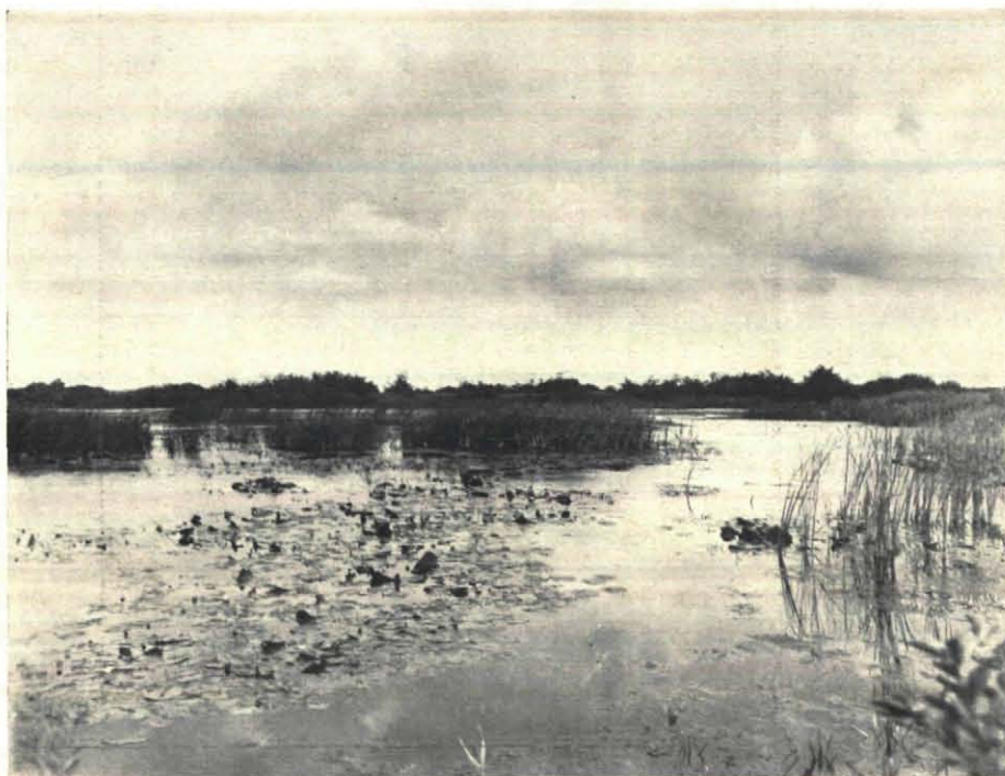
Fig. 2. Het Waterland van de oude Venen.

Scirpus lacustris durft er het diepst te gaan. Met zijn grasgroene dikke stelen geeft hij een prachtig accent aan het vaak zoo donkere veenwater. Natuurlijk gaat de meest idyllische bekoring uit van het Phragmitesveld. De stevige stengels worden er een paar meter hoog en bieden schuil aan al de „zangers van het riet”. Na de broedtijd ziet ge al vrij spoedig de duizen-