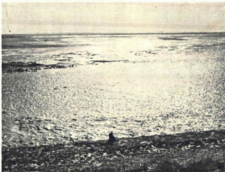
Fig. 1. Zon op het kale slik in het Noord-Sloe.

De vegetatie is evenals die op onze andere schor-