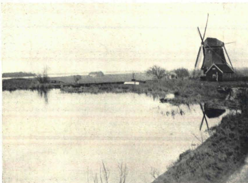
Fig. 1. De groene ruimte.

zijn tèèèèè-tèèèèè laat hooren. Dat kan wel beteekenen, dat we in de nabijheid van een nest zijn. Oei!!!! is dat schrikken! geen twee meter van ons af vliegt plotseling vrouwlief op en schiet onder een luid grutta-grutta pijlsnel naar boven. Die hebben we mooi verrast, even kijken. Tusschen het hooge gras vinden we ditmaal het nest gemakkelijk, want ze heeft in haar angst voor dat plotseling dreigende gevaar den toegang een beetje wit besmeurd. Een kuiltje, ongeveer twee vuisten groot, bekleed met enkele dorre vezels, vier eieren, dof groen van kleur. Het angstig geschreeuw van de langsnavel doet ons gauw verdwijnen en we keeren naar den polder terug. Ook daar wemelt het van grutto's. Trotsch en majestueus staat de koning der weidevogels tusschen het gras, een bruin-roode plek in het groen, den sierlijken kop met den langen snavel een weinig schuin, zoodat één oog ons bewaakt, gereed onmiddellijk het wit