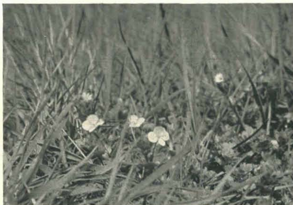
Fig. 2. Grootte Eereprijs ( Veronica Tournefortii ).

alom, slechts nu en dan plonst een dartele visch aan de oppervlakte, vier aalscholvers vliegen over met kalmen vleugelslag, den nek rechthoekig gebogen, een vischdiefje wiekt voorbij en loert op buit. Dauw beplekt nog met zilveren droppels het gras aan den oever, het jonge riet spreidt zijn teere kleuren aan den voet van den ouden bruinen rietkraag, waarboven enkele pluimen vroolijk wuiven. De waaivormig uitgespreide bladeren van de lisschen spiegelen zich in het nat, naast het gerimpelde blad van den kalmoes. We verlustigen ons even in den aromatischen geur van dezen Aziatischen immigrant en gaan dan verder, want we hebben nog steeds niet onzen roerdomp ontmoet. Hij voelt vanmorgen zeker niets voor deze ongevraagde afspraak en vindt het rietmoeras veiliger dan den waterkant. Een meerkoet neemt een klaterenden aanloop over het water, als we het riet binnendringen en zoekt met snelle vleugelslagen zijn kornuiten aan den anderen oever op, de kleine rietzanger gooit zich dartel in de lucht en schiet dan naar