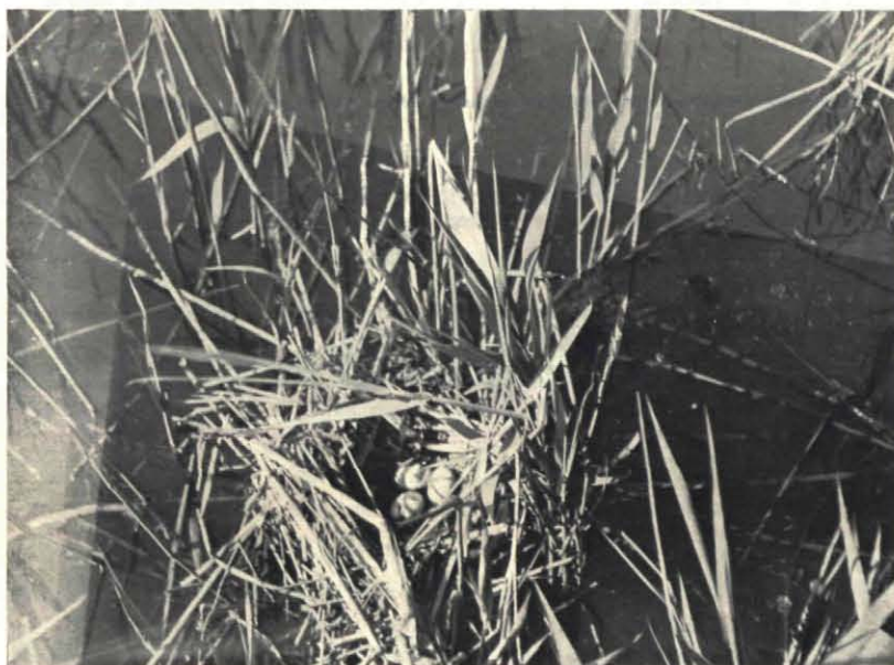
Fig. 4. . . . Slechts drie eieren . . .

Langzaam glijden we verder, we zullen nog even ons veenlandje bezoeken. In het heldere