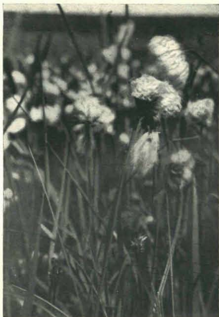
Fig. 3. Wollegras.

beneden op een rietstengel, luid klinken de klanken uit zijn keeltje. Opmerkelijk is het, dat hij af en toe het „tululuu” van den tureluur duidelijk nabootst. Daar nadert een mugje angstvallig dicht zijn snavel en zonder op te houden met zijn vroolijk gezang wordt een hap gedaan naar deze prooi. Mis! ook een vogel kan niet altijd twee dingen tegelijk doen.