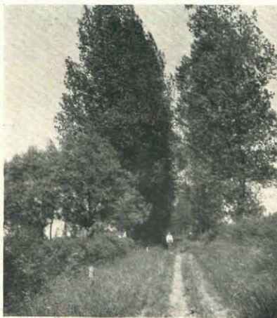
Fig. 10. Een landweg, grootendeel door hooge boomen overschaduw.