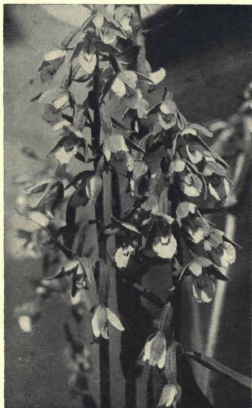
Fig. 2. Moeraswespenorchis .

Nu gaan we op de andere planten letten. Orchis Morio groeit hier in vele exemplaren. Zoo heel vaak zien we de Harlekijn-orchis niet in de omgeving van onze stad. Als we — laat eens kijken — vier, vijf groeiplaatsen in de buurt hebben, nou, dan is 't daarmee gezegd ook!