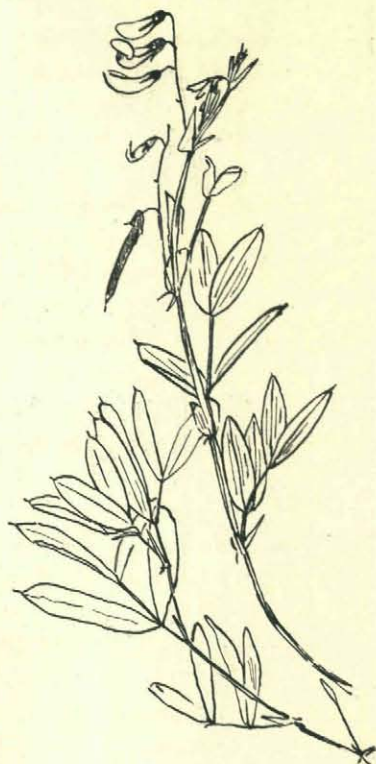
Fig. 1. Knollathyrus .

Eerst zoeken naar de varentjes. Nergens te zien! Zouden ze verdwenen zijn? Wat