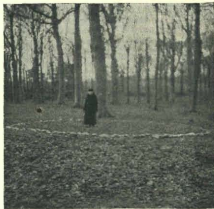
Fig. 1. Heksenkring van Nevelzwam. Elswoud Nov. 1936.

Zeldzame Paddenstoelen. Sedert de opening van het natuur-historisch museum zijn de volgende paddenstoelen, in den omtrek van Tilburg gevonden, in