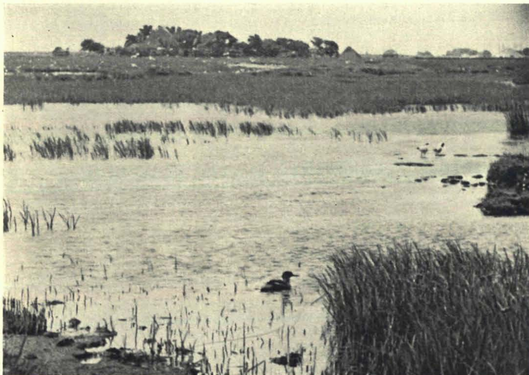
Waar de witte meeuwen vliegen is Burdet's Hop. Daarachter de boerderij Dijkzicht in de buurtschap Dijkmanshuizen op Texel.

Deze aankoop is mogelijk geworden door de blijmoedige medewerking van vrienden en