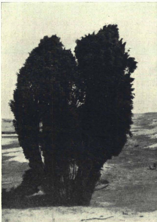
Fig. 2. „Getuigen uit het verleden”.

teruggebracht: alleen de 3 urnen zijn medegenomen om een veilige plaats in een Museum te krijgen.