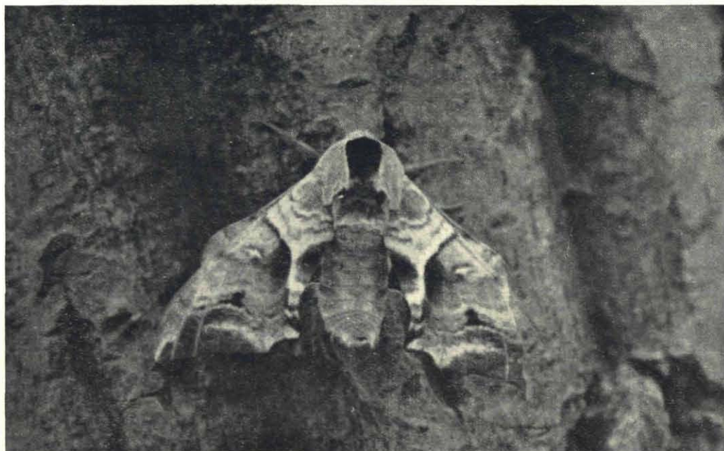
Fig. 1. Vlinder van de Pauwoogpijlstaart in rust.