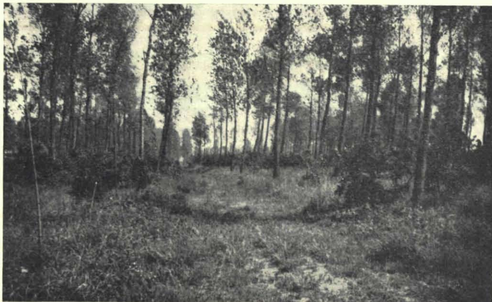
Het bos op het Groot Eiland te St. Jansteen.

Op 27 Augustus 1947 hadden mijn broer en ik onze tent opgeslagen op het Groot Eiland te St. Jansteen in Oost-Zeeuws-Vlaanderen. Diezelfde dag bleek aan de op het Zuiden gelegen helling van een sloot langs een bospad een nestgang van onze mooie zwartrode Steenhommel te zitten. Het nest bevond