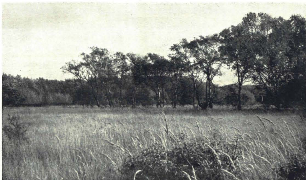
Fig. 4. „Bierlap”. Gezicht op een vlak, dicht met Duinriet begroeid terrein, het type, waarin de blikken 34, 35, 36 en 49, 50, 51 staan, Oktober 1955.

terrein met enkele kleinere bosschages (fig. 2).