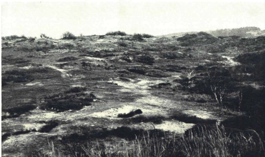
Fig. 2. „Gebied bij de Natte Sprang”. Van rechts naar links: het terrein met verspreide berken, waarin de blikken 67, 68, 69; kleine stukjes kaal zand, waarin de blikken 64, 65, 66; geheel links een vlak terrein begroeid met mossen en korstmossen, waarop de blikken 61, 62, 63. Oktober 1955.

tezamen, zijn dus de aantallen dieren van een bepaalde soort, die in de vangblikken worden aangetroffen, ten allen tijde minimum aantallen.