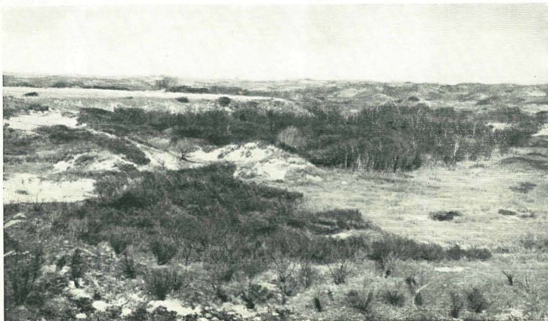
Fig. 3. „Gebied bij de Elleboogsprang”. Het bos in het dal is het „Rozenbos”; op het terrein vóór het „Rozenbos” staan de blikken 85, 86, 87 en 100; links op de achtergrond is de hoogvlakte met de blikken 88 t/m 93 zichtbaar. April 1955.

Een aantal specialisten bewerkt dit materiaal, ieder een bepaalde groep. Bij een aantal groepen is dit een schier onbegonnen taak, zodat we met het bewerken van het materiaal steeds verder achter raken bij het verzamelen uit de blikken. Speciaal spinnen en miljoenpoten staan in dit verband in een kwade reuk.