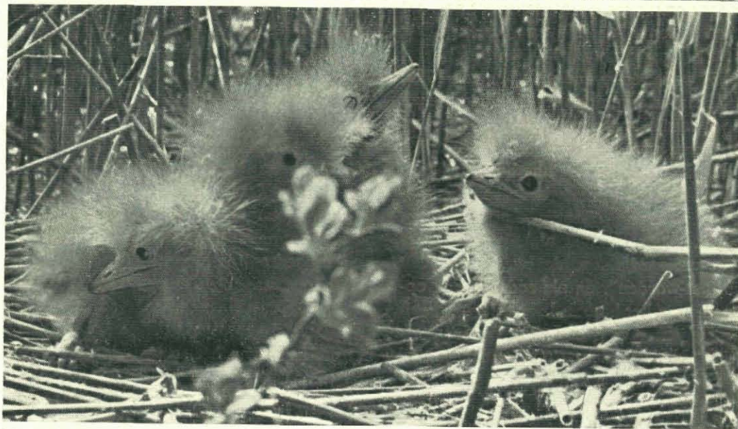
Fig. 1 en 2. Nest met eieren en nest met jongen van de Roerdomp. Deze vogel, die over een groot deel van Europa en door Noord-Azië tot in Japan voorkomt (in Engeland echter zo goed als uitgeroeid is door eierverzamel-maniakken), is vooral bekend door de „paalhouding”, welke hij bij onraad aanneemt. Hij zakt dan in de hielen door en strekt de lange hals en de snavel omhoog. Door de overlangse bruine en lichte streep-tekening van borst en hals valt hij zo tussen het riet of tussen wilge- of elzetakken nauwelijks op.