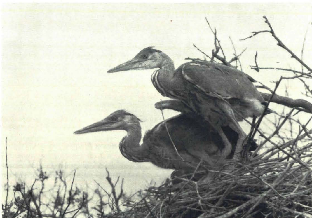
Fig. 3. Vliegvlugge jongen van de Blauwe reiger.