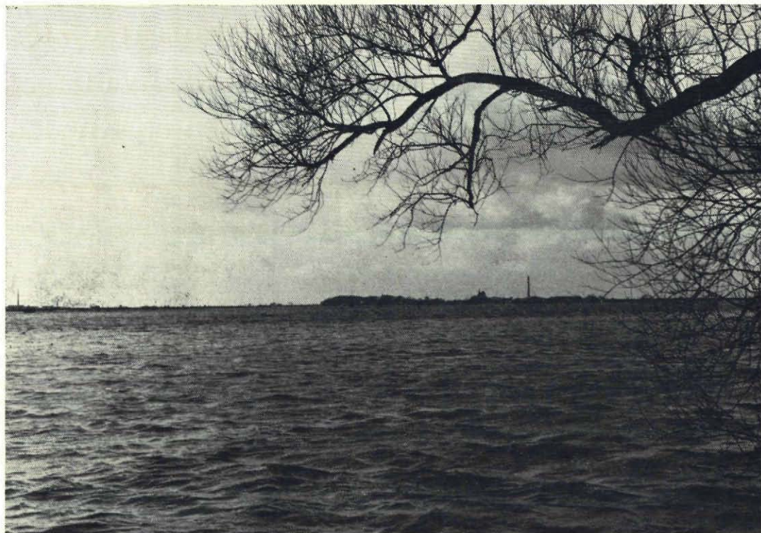
Fig. 2. Hoogwater in de Lunenburgerwaard en de waarden van Gravenbol. Op de achtergrond het silhouet van Wijk bij Duurstede.

van ogenschijnlijk gelijksoortige uiterwaard-elementen tot grote gehelen, volgen.