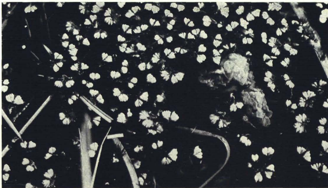
Fig. 3. Monsterpunt 2. Kroosmos en darmwier.

en de Kleine watersalamander ( Triturus vulgaris ) werden door ons ook niet gevonden, maar blijkens een bericht in het „Nieuwsblad voor de Hoeksche Waard, IJselmonde en Putten” werd door de heer Van Leeuwaarden zowel de Driedoornige stekelbaars als de Kleine watersalamander gevangen, terwijl hij de Groene kikvors had gehoord, maar niet gezien (9).