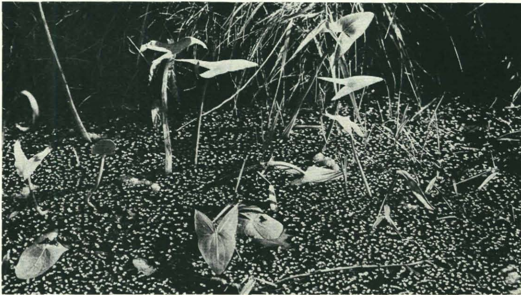
Fig. 2. Monsterpunt 2. Pijlkruid en Kroosmos. De rhizoiden van het Kroosmos houden de plantjes op regelmatige afstand van elkaar.

Deze lijst van aangetroffen water- en oeverplanten kan zeker nog uitgebreid worden. De heer H. G. van der Weijden deelde ons mede, dat hij in het zuidelijke deel niet ver van de bebouwing in de zuidpunt van het Oude Land van Strijen het zeldzame Kransvederkruid ( Myriophyllum verticillatum ) had gevonden op de grens van schoon en meer vervuild water (augustus 1972). Duidelijke vuil-schoonwater gradiënten zijn ook in het noorden van het Oude Land waar te nemen. Langs de noordelijke weg, die de scheiding vormt tussen de St. Anthoniepolder en het Oude Land, is het water troebel met een kroosdek van Bult- en Veelwortelig kroos. Deze vegetatie gaat meer naar het zuiden, dus naar het centrum van het Oude Land, over in schone slotjes met Kroosmos ( Ricciocarpos natans ). Ook vanuit de weg naar het noorden, de St.-Anthoniepolder in, is deze gradiënt waar te nemen. Soorten als Glanzig fonteinkruid, Brede (= Canadese) waterpest, Kroosmos, Watervorkjes en de