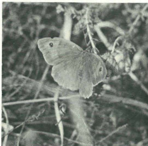
Fig. 4. Bruin zandoogje, ♀. Naar kleurendia.

Geven we alsnog in bijgaand staatje (tabel 1)