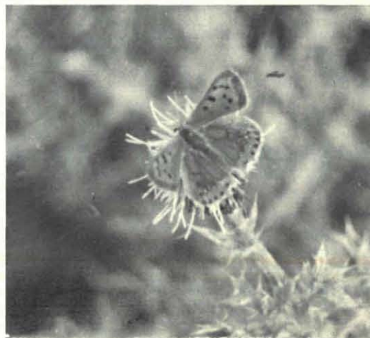
Fig. 2. Vuurvlindertje. Naar kleurendia.

Om te beginnen dan de rangschikking volgens de allerlaatste door ons opgemerkte vliegdata in het Gelderse waarnemingsgebied: 1) Kleine vos 21-11-1976, 2) Citroenvlinder 14-11-1976, 3) Dagpauwoog 4-11-1973, 4) Atalanta 31-10-1976, 5) Gammauil 31-10-1975, 6) Gehakkelde aurelia 27-10-1972, 7) Knollewitje 24-10-1976, 8) Distelvlinder 23-10-1969, 9) Vuurvlindertje 23-10-1969, 10) Argusvlinder 11-10-1976, 11) Icarusblauwtje 9-10-1969, 12) Klein geaderd witje 7-10-1971, 13) Koolwitje 3-10-1973,