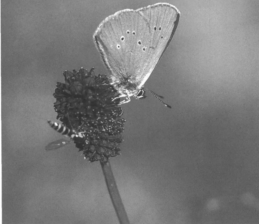
Het Donker pimpernelblauwtje ( Maculinea nausithous ) krijgt in Noord-Brabant meer ruimte.