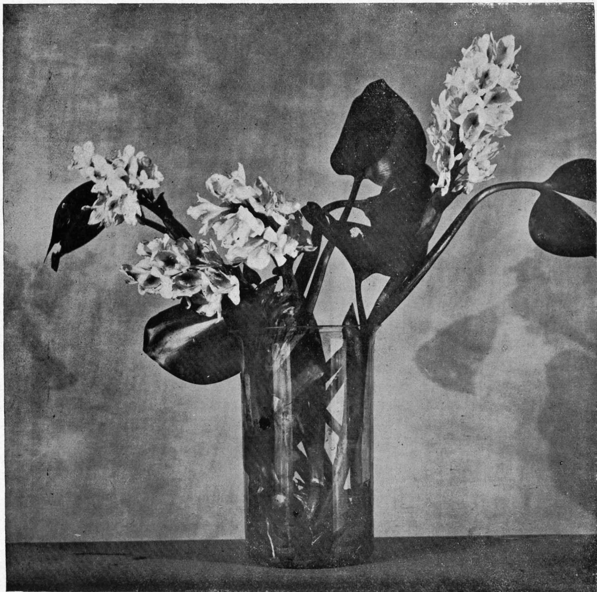
Fig. I, zie pag. 110.

de gras-wildernissen met Casuarinen ) besloten we, het ravijn zóóver benedenwaarts te volgen, dat we van een pad, waarvan de bevolking sprak, gebruik konden maken. Onze poging daartoe ondervond eerst nog een kleine tegenwerking van de zijde der koelies: die heeren waren daags te voren volgens hunne meening te zeer vermoeid geraakt en konden dat alleen vergeten tegen verhooging der betaling. Nu lukte hun dat natuurlijk niet, maar