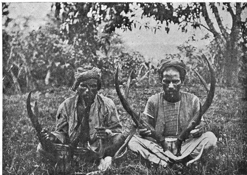
Twee goede „Sambur” geweien, en klein „Spotteddeer” gewei.

dat in het water gemengd wordt, waarna alle vuil en modder bezinkt, en het heldere drinkwater (?) kan afgegoten worden. De windrichting is goed en stevig loopen we door, een enkel geluid hindert nu niet, daar de olifant slecht van gehoor is en zelf steeds zooveel leven maakt. Soms wordt beweerd, dat het meerendeel doof zou zijn, wat we niet gelooven, noch beoordeelen kunnen. Hun gezicht is zwak maar hun reuk zeer scherp. We staan aan