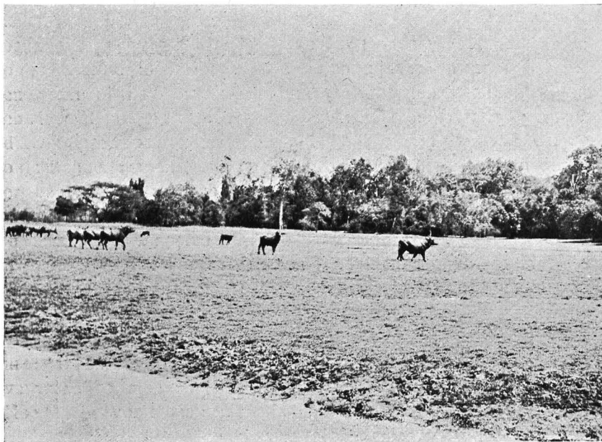
Kudde buffels op „talawa”.

Vlak voor me, geen 7 meters van me af, is een kudde buffels ( Bos bubalus ) om een modderpoel vereenigd. De groote stier staat behagelijk tot aan den buik in het zwarte water. De andere acht, koeien, liggen kalm te herkauwen of te slapen. Wat heb ik dom gedaan mijn kodak achter te laten! Wat een gelegenheid die ik nu moet missen. Onwillekeurig heb ik me op de knieën verheven om ze nog beter van vlak bij te bezien. De stier, de aanvoerder en schildwacht der kleine kudde, heeft me echter opgemerkt. In twee tellen is hij uit het bad, en staat de bende in een halven cirkel, hevig blazende, de domme, leelijke koppen met de zware hoorns naar voren gestrekt, me aan te kijken. Het is een grootsch gezicht, die wilde woeste reuzen, de huid donkerbruin bijna zwart, zware gespierde halzen en nog zwaarder lichamen op de korte sterke pooten. Banda staat ze kalm