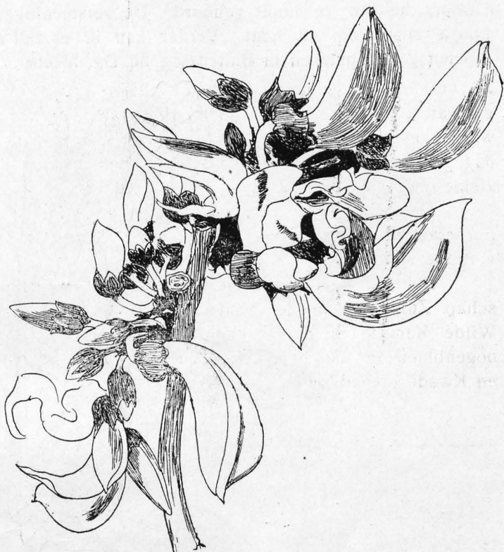
Butea monosperma (Lam) Taub. (Ploso).

Als we nu een zijweg inslaan komt er eenige afwisseling in den tocht; de koetsier moet soms uitstappen, om zijn paarden over een hindernis heen te helpen. Maar nu zijn we er ook gauw en aldra staan we tegenover de historische plek. Ik voel een lichte ontroering. De hooge oevers zijn van witte gelaagde padas, die zich met de handen