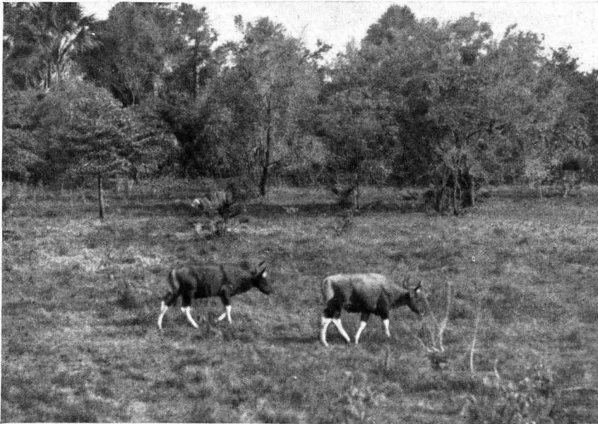
Fig. 4. Twee jonge stieren, die ik steeds samen zag uitkomen.

Men kan over de oorzaak van een dergelijk gedrag van het wild zeer uiteenlopende theorieën huldigen. Het meest voor de hand liggend is natuurlijk te beweren, dat het dier, dat zich tot op korten afstand door den mensch laat benaderen, zoo mak is, dat het in onze persoon geen groot gevaar meer ziet,