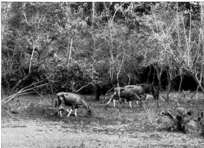
Fig. 3. Kleine kudde bantengkoeien, die enkele dagen achtereen in dezelfde formatie uitkwam, grazend in het ijle randbosch.

In het zware bosch, waarmede het grootste gedeelte van het schiereiland is begroeid en waarin de ondergroei voor een groot deel bestaat uit bamboe, salak, rottan, langkap, enz., trof ik hoegenaamd geen sporen van bantengs aan. Dit gebied wordt hoogst zelden doorhenbezocht, hetgeen waarschijnlijk zijn oorzaak vindt in het gebrek aan weideplaatsen in het binnenland, dat ook overigens weinig voor deze dieren zal opleveren. Het geheele leven der bantengs speelt zich af op de meer open