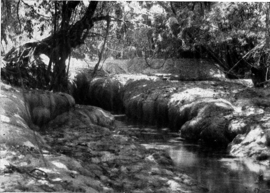
Fig. 2. Kalibedding in het binnenland van Oedjoeng-Koelon.

Van wilde honden, die onder het kleiner wild duchtig opruiming schijnen te kunnen houden en zich, o.a. volgens Dr BARTELS, niet ontzien bantengkalveren te slaan, heb ik tijdens mijn verblijf in Oedjoeng-Koelon niets gemerkt, hoe-