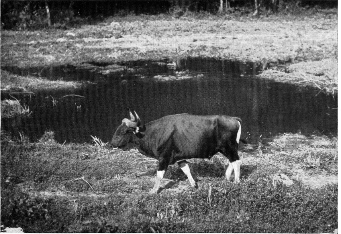
Fig. 7. Bantengstier, die doorgaans om ongeveer 1 uur 's middags alleen uitkwam en zich later op den middag bijna steeds bij een andere kudde aansloot.

dezelfde dieren. Ofschoon het mij niet mogelijk bleek alle individuen uit elkaar te houden, was het met behulp van mijn aantekeningen toch wel mogelijk vele dieren van elkaar te onderscheiden. Want bij nauwkeurige beschouwing zijn zoowel bij de koeien als bij de stieren vaak verschillen waar te nemen in de grootte en vorm der horens, in de huidkleur, in de plaats en den vorm der donkere vlekken, die de oude koeien vaak op de huid vertoonen, terwijl ook de kalfjes door het verschil in grootte en de oudere vaarsen en pinken door hun typischen horenbouw en huidskleur wel van elkaar zijn te onderscheiden.