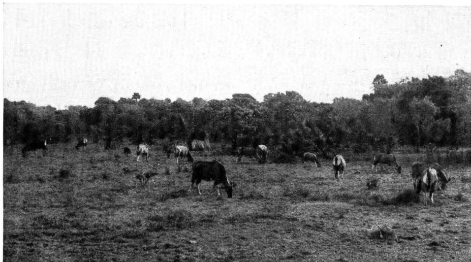
Fig. 6. Een gedeelte van het groote aantal bantengs, dat elken dag op deze weide graasde en gevormd werd uit vele kleine groepjes, die afzonderlijk uitkwamen; op de linkerhelft der foto ziet men een wild zwijn.

Zoals ik reeds opmerkte, zijn de gegevens van den heer FRANCK voor wat Oedjoeng-Koelon