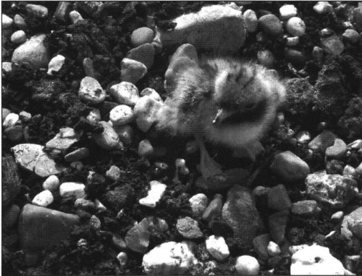
Een pul van een Visdief in de volle zon op het grinddak van het bedrijf in Nieuw Vennep.