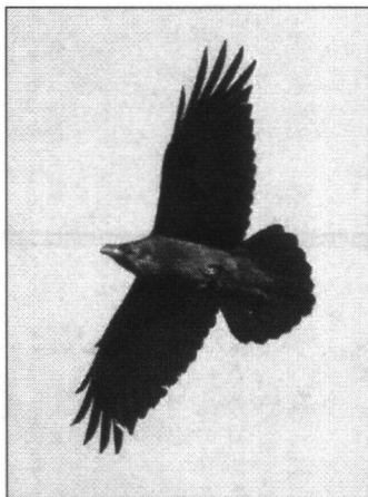
De vliegende Raaf is onmiskenbaar met de waaiervormige staart en een vleugelspanwijdte van 1.20 meter

Tijdens de hevige Duitse bombardementen op Londen in de Tweede Wereldoorlog verdwenen de Raven op één enkele na. Engelsen zagen daarin een voorteken dat hun land op wankelen stond. Maar Raaf James overleefde alle rampspoed en kreeg gezelschap van vijf nieuwe Raven. Het enige dat de vogels niet is vergund is wegvliegen, vandaar dat de oppasser de grote slagpennen van de koninklijke Raven regelmatig inkort. Het is wel duidelijk dat de Raven, als ze daartoe de kans krijgen, druk Londen liefst voor een iets rustiger omgeving verruilen. De Raven Master is regelmatig met de dieren bezig, waarbij hij zijn handen in stevige leren handschoenen hult, want een Ravensnavel blijkt groot, sterk en pijnlijk! Maar je moet er iets voor over hebben, want wie kan vandaag een koninkrijk bij elkaar houden voor de somma van 18 shilling per week?