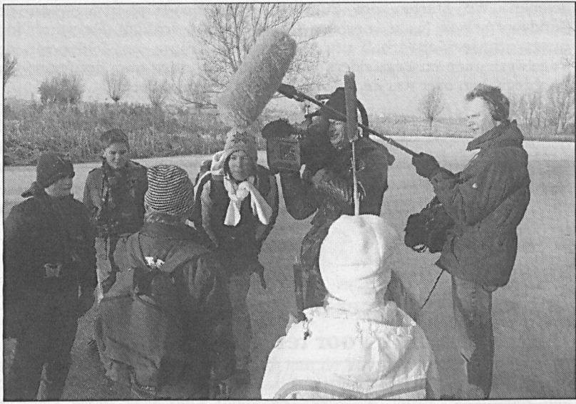
Televiesternen van de Jeugdvogelclub tijdens opnamen in de Heksloot.