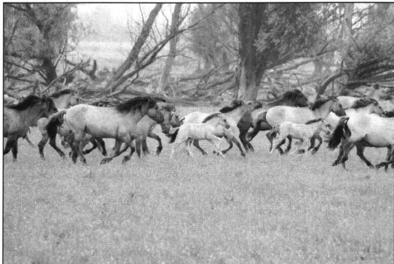
Prachtig beeld: een kudde Konikspaarden in de Oostvaardersplassen.