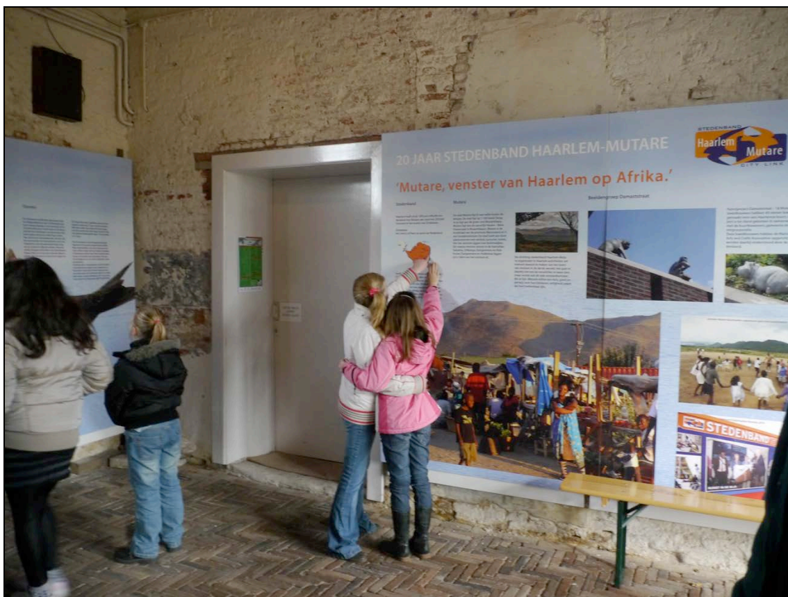
De expositie over het gierzwaluwenproject in Ter Kleef.

Dit jaar heeft Haarlem-Mutare samen met de gemeente, natuurbeschermingsorganisaties, kunstenaars en onderwijsinstellingen een groot aantal activiteiten ontwikkeld rond de Gierzwaluw. De Gierzwaluw wordt bedreigd door het verdwijnen van geschikte broedgelegenheden. Daarom heeft de stichting activiteiten georganiseerd om nieuwe broedgelegenheden te creëren en de vogel onder de aandacht van het publiek te brengen.