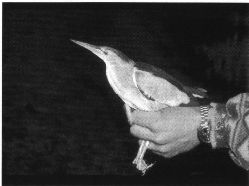
Woudaapje in de AWD. Hans Vader.

De Latijnse naam van dit reigertje is Ixobrychus minutus en dat betekent: zeer kleine harskleurige bruller. Persoonlijk vind ik zijn vroegere naam Wouwaapje beter, want het geluid dat het mannetje voortbrengt klinkt als een hees blaffend wouw-wouw. Ons kleinste reigertje heeft een lengte (gestrekt) van 33-38 cm en een spanwijdte van 49-58 cm. (ter vergelijking, een Blauwe reiger heeft een lengte van 84-102 cm en spanwijdte van 155-175 cm) Dat betekent dat als het Woudaapje rechtop staat, hij zeker niet hoger is dan 25 cm en sluipend door het riet nog minder.