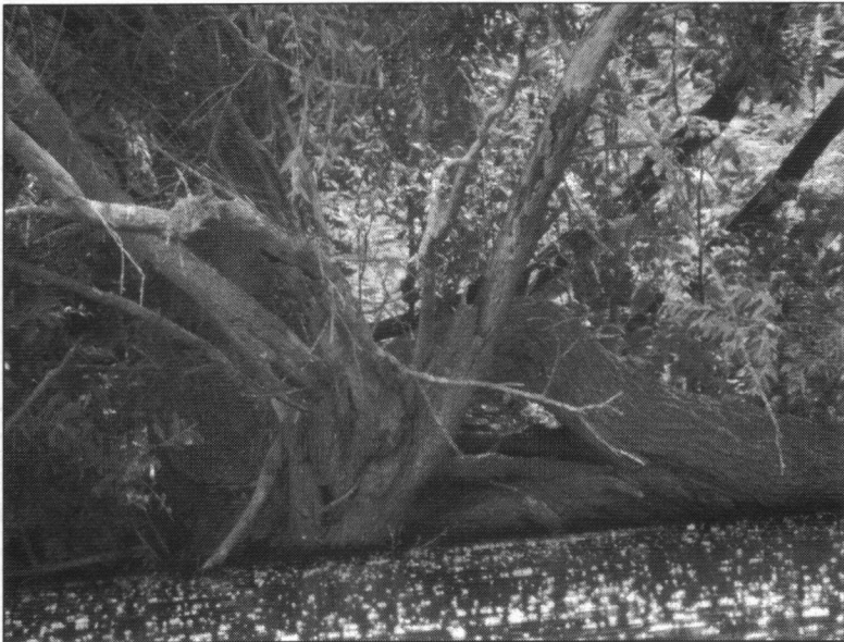
Put van Vink; zoek de IJsvogel.