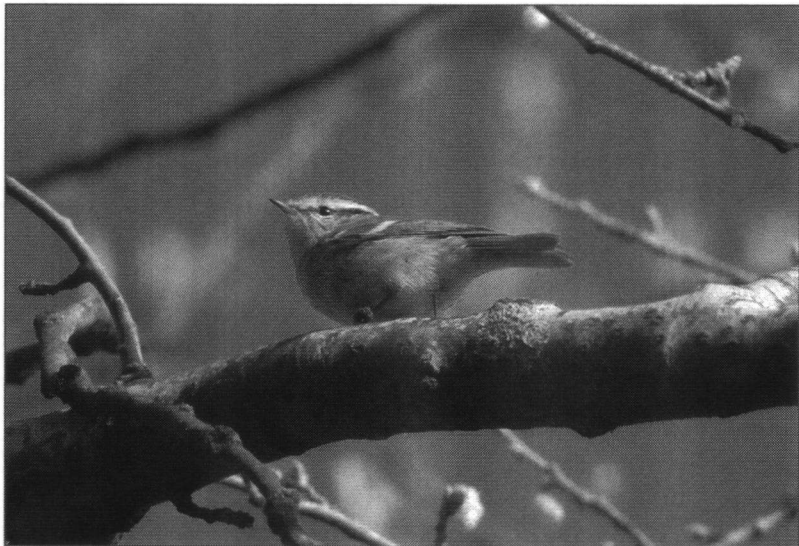
Een Pallas Boszanger was een van de leuke soorten die afgelopen winter in de regio werden gezien. Berry van der Hoorn

In de Toolenburgerplas bij Hoofddorp broeden elk jaar Oeverzwaluwen. Ze zitten daar in een kunstwand. Weet je niet wat dat is? Ga dan mee! Ook zijn er allerlei andere vogels in dit gebied te vinden. Misschien wel de Zwartkopmeeuw! Verzamelen: voorkant Station Haarlem. Vandaar nemen we om 9.13 uur de Zuidtangent naar halte Toolenburg. We lopen naar de Toolenburgerplas. Om ongeveer 12.10 uur zijn we terug. De Vogelwerkgroep zorgt voor strippenkaarten.