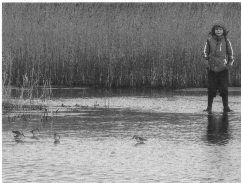
Makke Bonte Strandlopers bij het Kennemermeer.

Dit keer bezochten we de pier van IJmuiden in december. We gingen met bus 4 die ons vlak bij het strand bracht. Hier merkten we pas hoe hard de wind is. We liepen dan ook maar tot het tweede hek, verder kon niet, want de golven sloegen over de pier. Enkele kinderen hadden het wel spannend gevonden, maar we wilden toch graag met alle kinderen thuis komen.