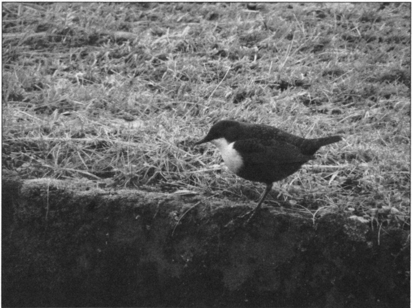
Waterspreeuw met visje.

Zondag 10 januari hoopten we met 12 kinderen de superzeldzame Waterspreeuw van de Amsterdamse Waterleidingduinen te vinden. Eerst keken we even bij de Oranjekom of daar wat leuks zat. Dat was niet veel. De nieuwe telescoop van Danny kwam trouwens goed van pas. Toen op zoek naar de Waterspreeuw. Maar zoeken hoefde niet. Dat beest zat te showen aan de overkant van een betonvijver. Hij zong, hij dook en zwom dat het een lieve lust was. En wat nu het leuke was, even