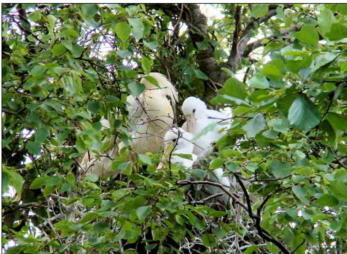
Broedende Lepelaars in de bomen bij De Liede.

Op 10 juni verkenden we met 11 kinderen de oevers van de Liede. De lepelaars in het bosje van Landschap Noord-Holland maakten indruk. Je kunt heel goed de bedelende jongen op de nesten bekijken. Af en toe daalde er een vogel boven de kolonie. Toen zijn we over de lange fietsbrug naar het rietveld van de Liede gelopen. Daar zagen we: rietzanger, rietgors, kleine karekiet, snor en bosrietzanger. Wat zingt dat vogeltje toch leuk. Hij imiteert er lustig op los. Dennis wees ons op alle koekoeken die rond vlogen. Best veel. Verder zagen we een sperwer, slechtvalk en boomvalk. We hebben ook gekeken naar grassoorten. De opdracht was aren van verschillende soorten te plukken. Eline vond 15 verschillende soorten gras!