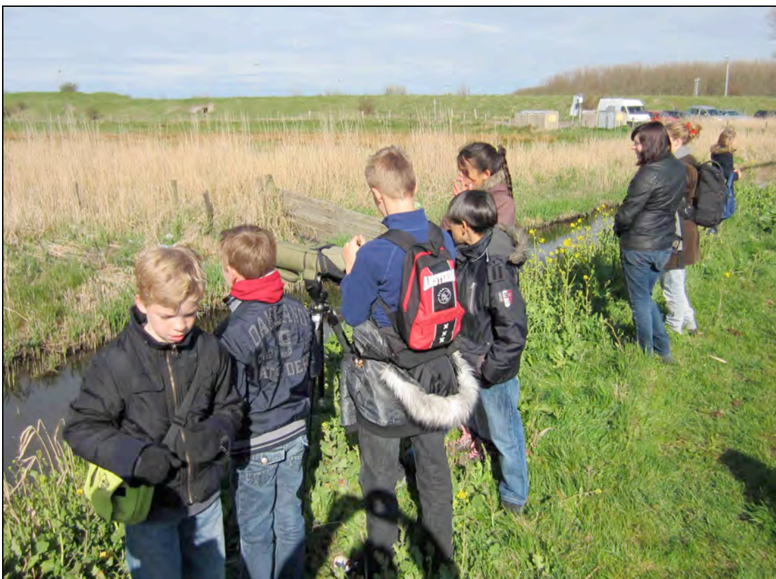
Op zoek naar de Blauwborst.

Minstens één keer per maand verkent de Jeugdvogelclub de natuur van Zuid-Kennemerland of de Haarlemmermeer.