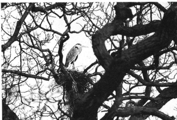
Nestelende Blauwe Reiger op Waterland. Deze vogel prefereert een Eik.

Samenvattend kan gesteld worden dat de Reiger het goed doet de laatste jaren. Het tellen van Reigerkolonies en het observeren van het gedrag van deze boeiende vogel is één van de leuke en tevens vrij makkelijke aspecten van vogels kijken. Mensen die kolonies willen (helpen) tellen of nog onbekend gebleven broedgevallen van Blauwe Reigers weten kunnen contact opnemen met Fred Hopman (02555-12391) of de Veldwerkcommissie.