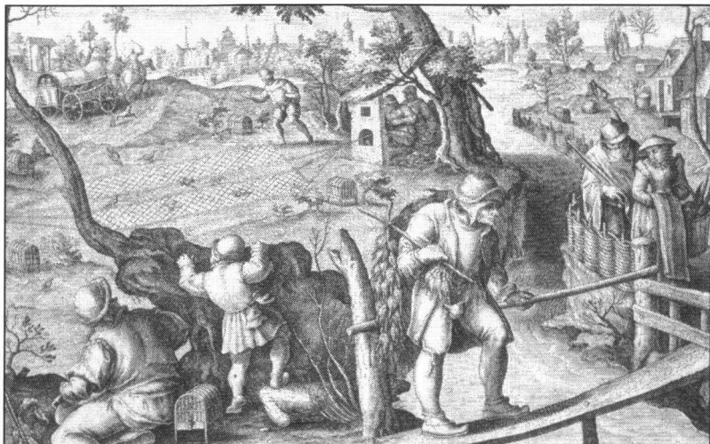
Philip Galle (1537-1612). Gravure van een vinkenbaan in bedrijf. De man op de brug draagt de vangst in bundels aan een stok.

De vinkenbaan lag met de lange zijde loodrecht op de trekrichting. Die was in het najaar overwegend zuidwest gericht waarbij vogels de kustlijn volgden. Aan een van de korte kanten van de baan (meestal de oostzijde) lag het vinkenhuis of de vinkershut. Aan de zuidelijke lange kant en aan de tegenover het vinkershuis gelegen korte kant werd een aarden wal opgeworpen van een meter of meer hoogte, om de baan in het kale landschap luwte te geven. Om overvliegende vogels tot aanvliegen te prikkelen werd op die wal dood, maar ook wel levend, hout geplaat van enkele meters hoogte.