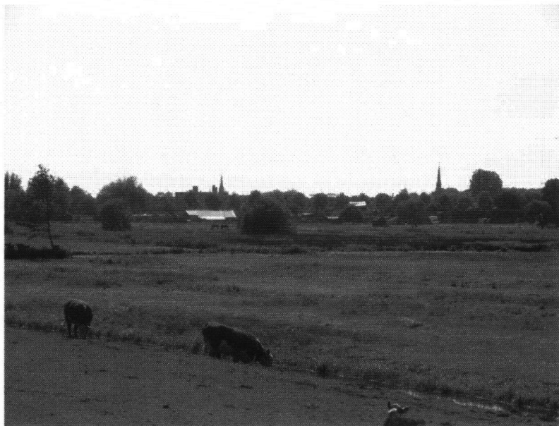
De Weerlanerpolder met op de achtergrond de oprukkende bebouwing van Hillegom, mei 2011.